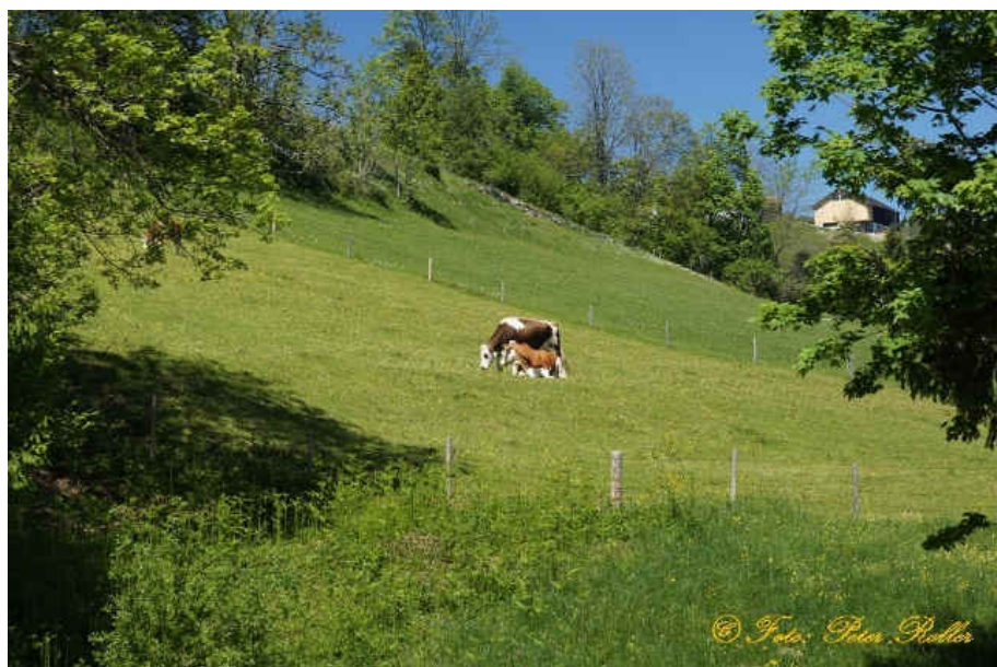
Alm bei Hinteregg